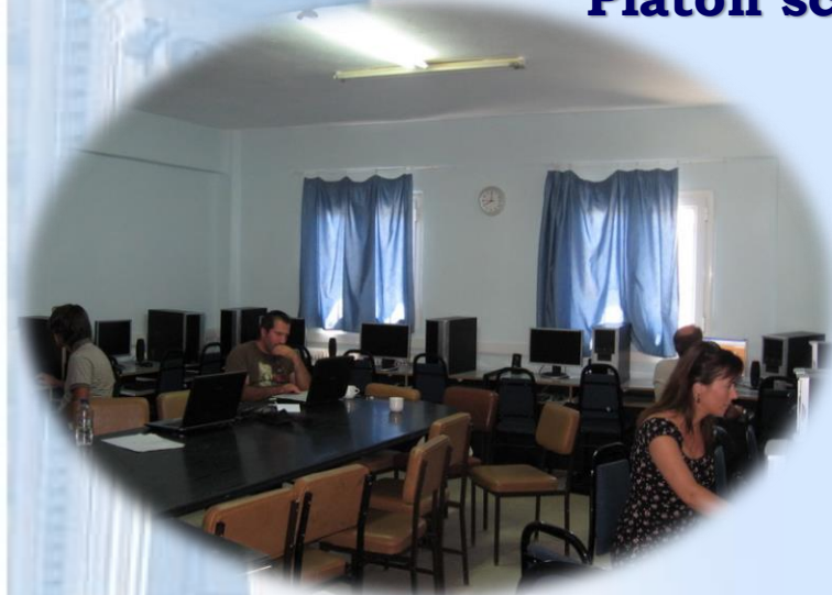
Colegiul National, Iasi