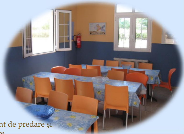
MOODLE- instrument de predare și învățare