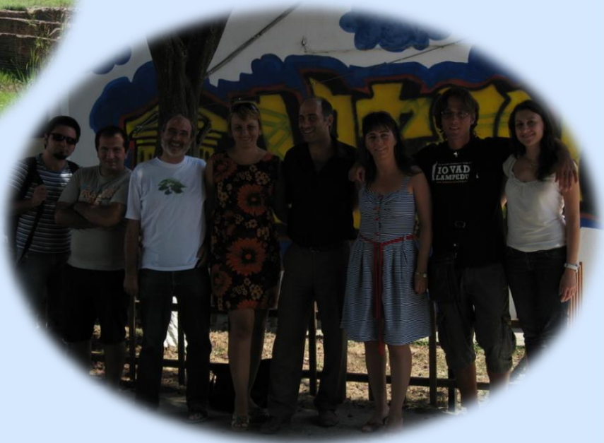
Colegiul National, Iasi